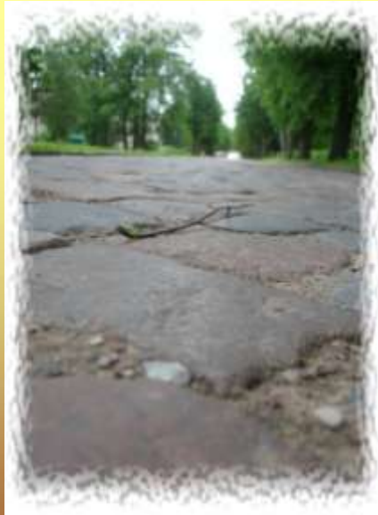
Foto: Santa Andruelytė Tauragės „Žalgirių“ vidurinė mok-la, 9 kl.