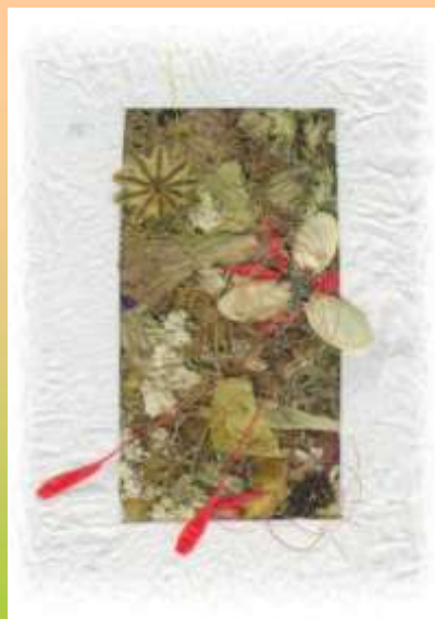
Monika Inciutė Pagėgių vidurinė mok-la, 10 kl.