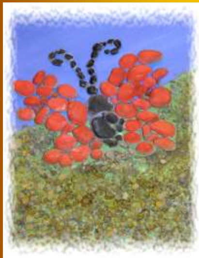
Evelinos Andriukaitės koliažas Lumpėnų pagrindinė mok-la, 8 kl.