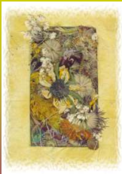
Justina Inciutė Pagėgių vidurinė mok-la, 10 kl.