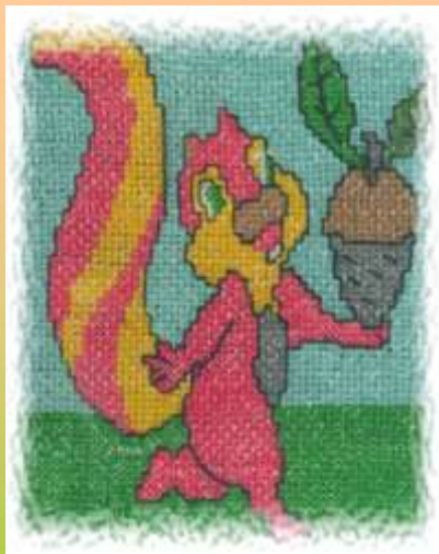
Agnė Bytautaitė Siuvinėjimas kryželiu Natkiškių pagrindinė mok-la, 10 kl.