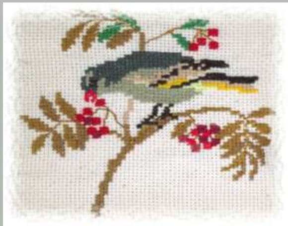
Alina Kelnerytė Siuvinėjimas kryželiu Lumpėnų pagrindinė mok-la, 9 kl.