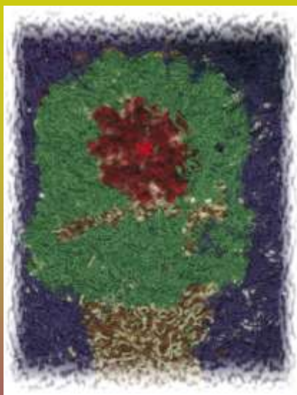
Kosto Maziliausko koliažas Stoniškių pagrindinė mok-la, 8 kl.