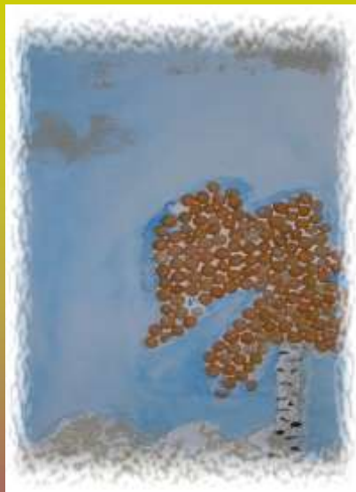
Kristinos Golubevos koliažas Pagėgių vidurinė mok-la 6 kl.