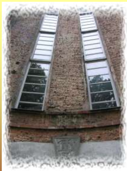
Šilgalių pagrindinė mok-la, 9 kl.