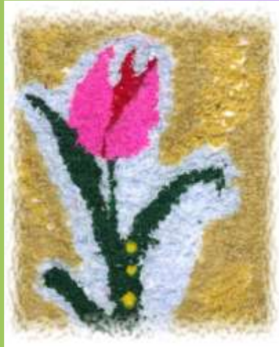
Vilijos Vismantaitės koliažas Stoniškių pagrindinė mok-la, 8 kl.