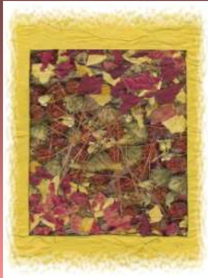
Justinos Kudinaitės koliažas Pagėgių vidurinė mok-la, 10 kl.