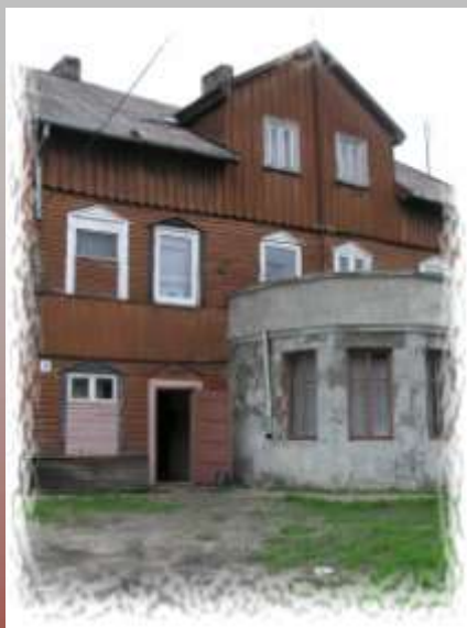
Pagėgių vidurinė mok-la, 11 kl