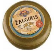
Garsieji Vilkyškiai plantinės siera Berühmte Käseherstellung der Molkerei von Vilkyškiai Знаменитые сыры Вилькишкинского молочного завода The famous cheese of the Vilkyškiai Dairy