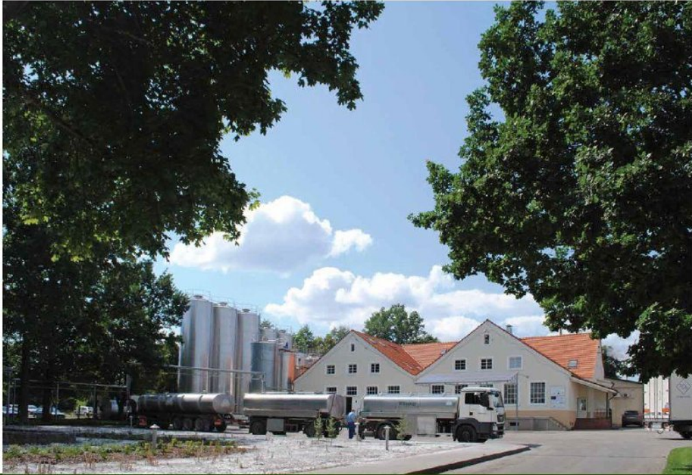
Vilkyškiai plantinė Molkerei von Vilkyškiai Вилькишкинский молочный завод Vilkyškiai Dairy