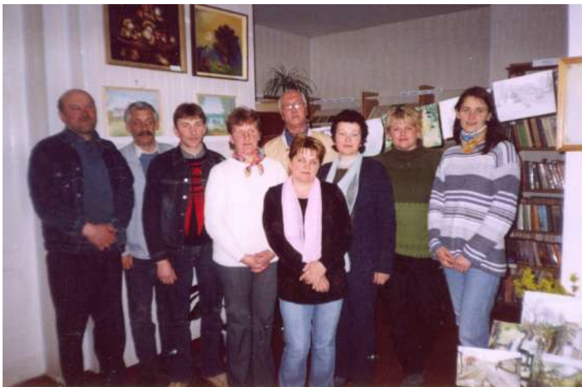
Pagėgių krašto menininkai plenero metu prie eskizų parodėlės. 2005 m.