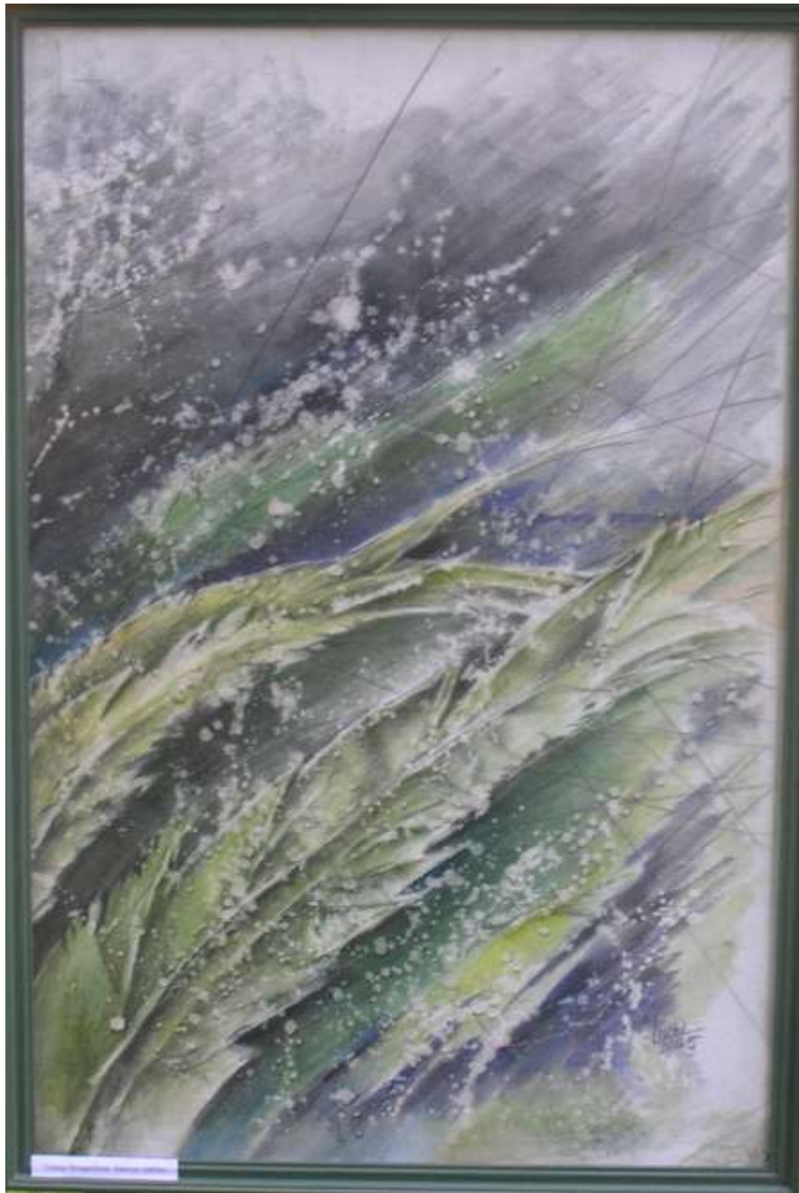
Liucija Bungardienė. Spalvos. 2005 m.