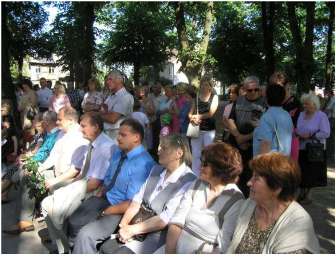
Parodos pristatymo akimirka.