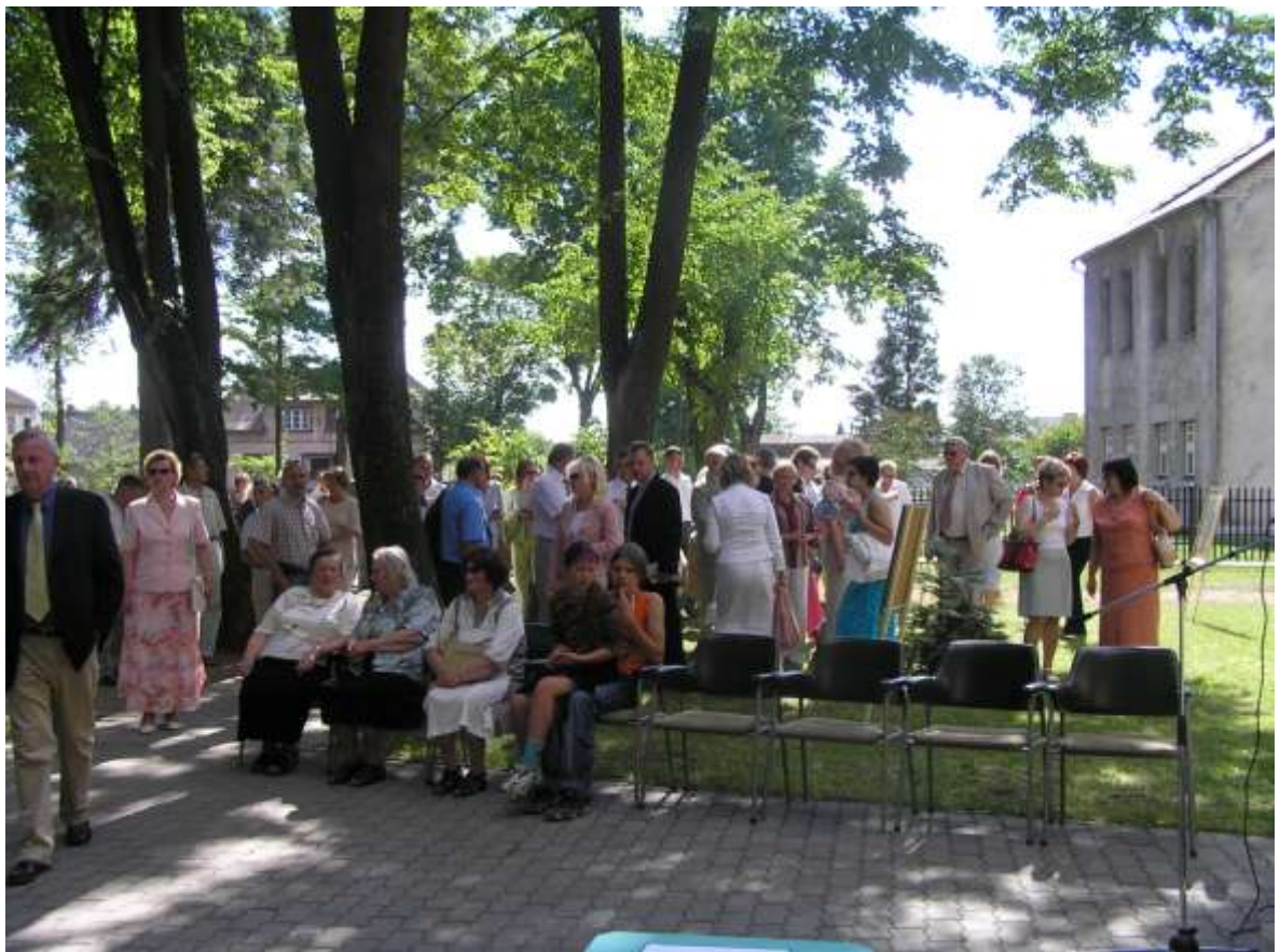
Bibliotekos kiemelyje pagėgiškiai ir svečiai apžiūri dailės darbų ekspoziciją