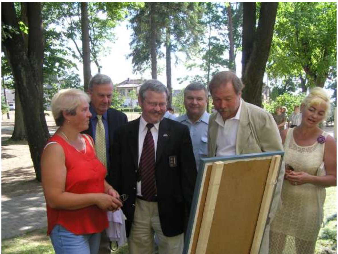
Pagėgių menininkų darbais domisi Švedijos Lommos komunos vadovai.