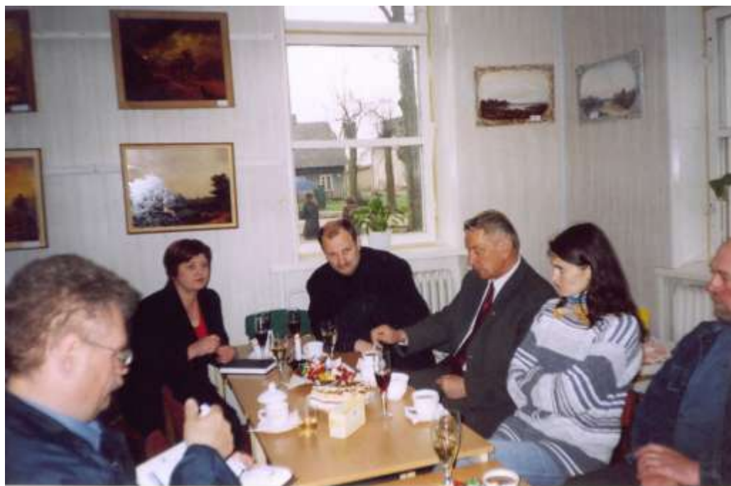
Pagėgių savivaldybės vadovai, organizatoriai ir dailininkai bibliotekoje aptaria būsimo plenero detales. 2005 m.

Į šių metų plenerą pakviesta 11 menininkų, jiems sudarytos sąlygos dirbti - pavėžėjimas automobiliu į pasirinktą vietovę, kiekvienam skirtos lėšos techninėms priemonėms įsigyti, maitinimas ir t.t.